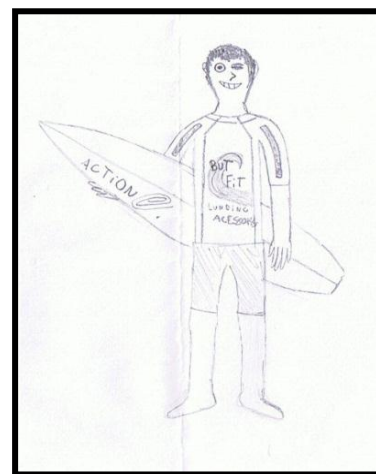
A praia para nós