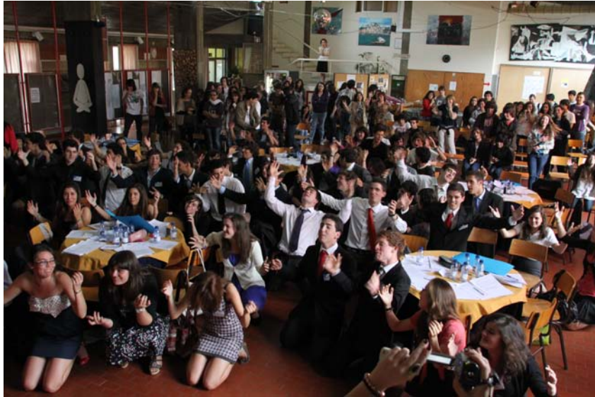
Equipa de organizers