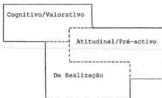
Fig. 2 - A aproximação dos três macroambientes

Consideramos a existência de três grandes ambientes "espaciais" : o cognitivo/valorativo, o atitudinal/pré-activo e o da realização. Este trio ambiental apesar de apontar para um contínuo ideal / real, globalidade / especificidade, teoria / acção, funde-se e confunde-se, esbatendo-se as respectivas fronteiras (fig.2):